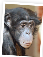
♀ BANYA °1990, 29 ans mère de Mokonzi