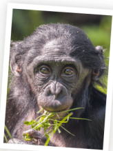
♀ NAYOKI °2012, 7 ans fille de Djanoa