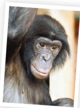
♂ MOKONZI °2013, 6 ans fils de Banya