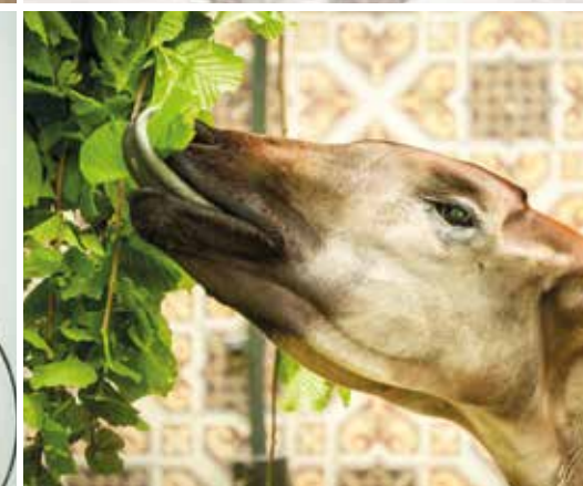
Cherchez les en-cas ! L'éléphant plonge sa trompe dans les trous du mur de nourrissage spécial. Les otaries aiment jouer et apprendre des tours d'adresse. Les chimpanzés sont si intelligents qu'ils parviennent à faire apparaître des gourmandises en faisant tourner des disques. Les okapis se régalent de branches.

leur trompe pour attraper des noix. Au cœur de l'été, les tigres reçoivent des glaces contenant de la viande gelée. Chez les hyènes, un scatterfeeder distribue de manière automatique de la nourriture dans l'enclos. L'effet de surprise est important. L'enrichissement doit être inattendu. Nos scientifiques, soigneurs ou leurs collègues étrangers ne manquent pas d'idées. Ils se les